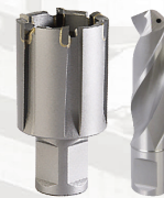
Frezy trepanacyjne TCTRail