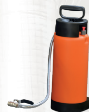
Ciśnieniowy zbiornik chłodzenia 5l -opcja